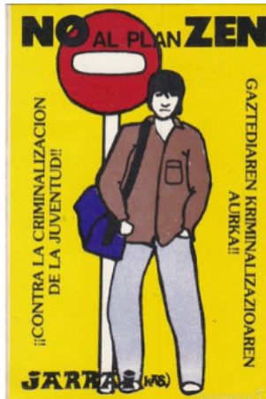
Vinyeta còmica publicada per Jarrai arran del Pla ZEN.