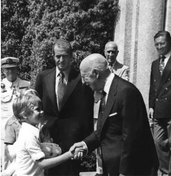
El rei Felip VI donant-li la mà a Francisco Franco amb el rei emèrit mirant al darrere

societat i en les estructures d'Estat sense ser jutjat, no com a altres països amb democràcies plenes.