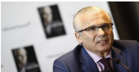
Baltasar Garzón en una de les seves múltiples conferències.