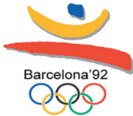
Logo de Barcelona 92.