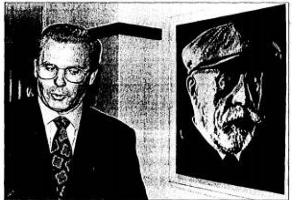
El magistrado Baltasar Garzón, junto a un retrato de Pablo Iglesias, en junio de 1993.