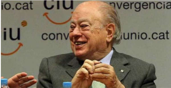
Jordi Pujol en una roda de premsa de CIU.

havia una voluntat de privar de llibertat a persones de manera indiscriminada, però dient que el jutge va anar més enllà del cercle de Terra Lliure, de tal forma que es van detenir a persones pel sols fet de ser independentistes; posicionament que pot arribar a ser contradictori (El País, 1992). Uns anys més tard, el mateix Jordi Pujol