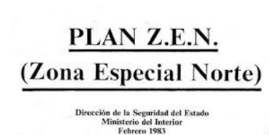
Capçalera inicial del Pla ZEN.

Aquest punt del Pla ZEN, de clar caràcter criminalitzador i acusatiu, va ser durament criticat per bona part de la societat basca. Se'n van fer diferents tipus de paròdies com la que es pot veure a la imatge de l'esquerra.