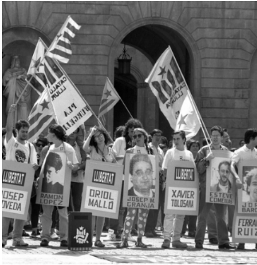
Manifestacions en contra de l'Operació Garzón.

Aproximadament van ser detingudes unes 50 persones entre el 29 de juny i el 14 de juliol de 1992 sota l'ordre de Baltasar Garzón, que era qui dirigia el Jutjat Central d'Instrucció Número 5 (d'aquí prové el nom del cas), de les quals 25 van ser jutjades a l'Audiència Nacional acusades de terrorisme, tinença d'explosius, associació a banda armada, tinença d'armes i dipòsit de municions d'armes de guerra. La sentència, feta pública el juliol de 1995, va condemnar a 18 dels 25 acusats, fet que