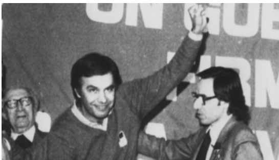
Felipe González al Congrés de Suresnes.

Quan es parla de democràcies a mig construir o democràcies que no són del tot plenes, no només es parla del poder legislatiu o executiu barrejat amb el poder judicial, o de la utilització les clavegueres de l'Estat per a qualsevol tipus d'objectius, o sortir d'una dictadura sense haver investigat els seus criminals i torturadors, sinó també és fins a quin punt la corrupció pot estar dins d'un partit polític governant i com se n'aprofita aquest, sota el nom de socialista i gràcies a suborns procedents de gent que vol parar el que