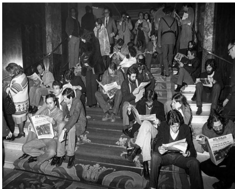
Periodistes llegint El País en l'Hotel Palace la nit del 24 de febrer de 1981.

Tots els diaris nacionals van sortir al carrer l'endemà condemnant la rebel·lió militar. La notícia va sortir també en diaris internacionals. Durant tota la nit, els espanyols van voler estar informats, per aquest motiu, es coneix la matinada del dia 24 com "la nit dels transistors".