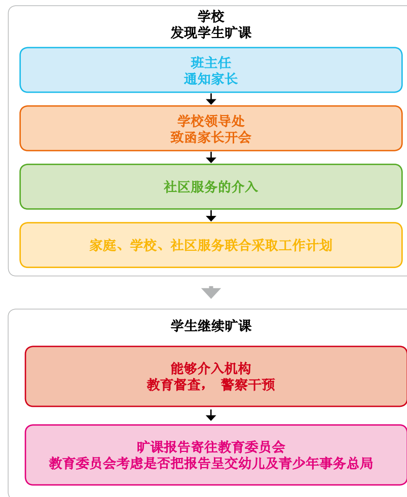
旷课时采取的协调机制