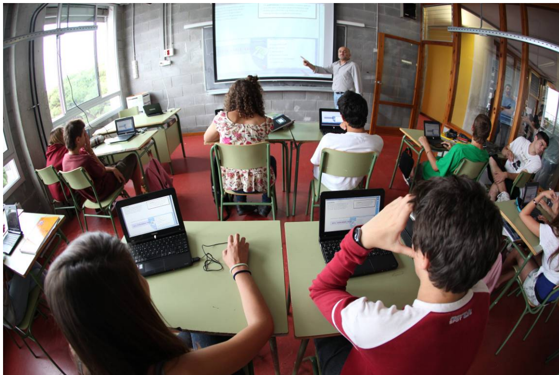
Barcelona, 7 de setembre de 2010

El projecte EduCAT1x1 rep un nou impuls a secundària i, per primera vegada, s'estendrà a educació primària, en una prova pilot en la que participaran sis escoles de la ciutat.