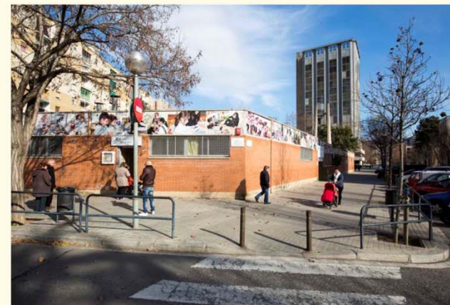
Escola La Pau