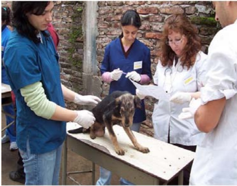
Figura 4. El Proyecto Piletones és una pràctica APS de la Facultat de Veterinària de la Universitat de Buenos Aires, adreçada a la prevenció de les malalties zoonòtiques en un dels barris més desfavorits de la ciutat.

Ara fa 14 anys, el Ministeri d'Educació, en col·laboració amb CLAYSS (Centro Latinoamericano de Aprendizaje y Servicio Solidario), va convocar per primer cop un seminari internacional sobre aprenentatge servei, que s'ha anat repetint cada any, associat fins fa poc a l'atorgament de premis «presidencials» sobre APS, al qual s'hi presenten centres educatius de tots els nivells.