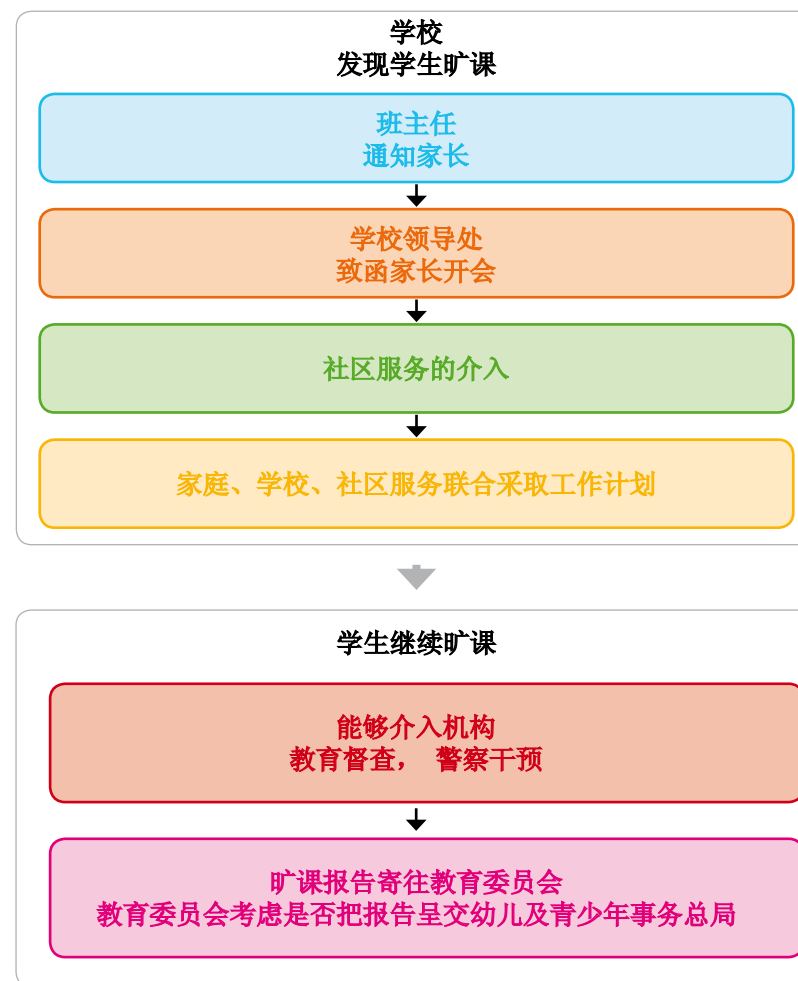
旷课时采取的协调机制