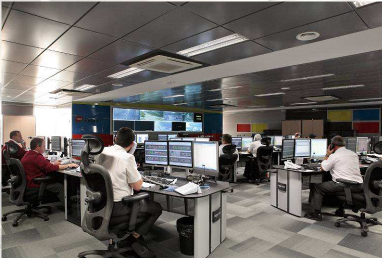
Sala del CRT