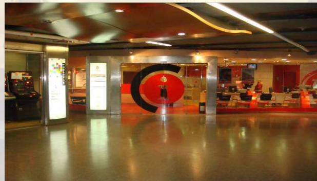
CIAC – Oficina d'Atenció al Client