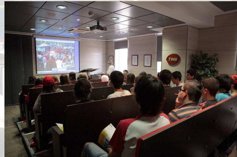
Sala de treball