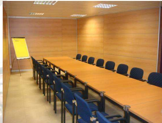
Sala de treball