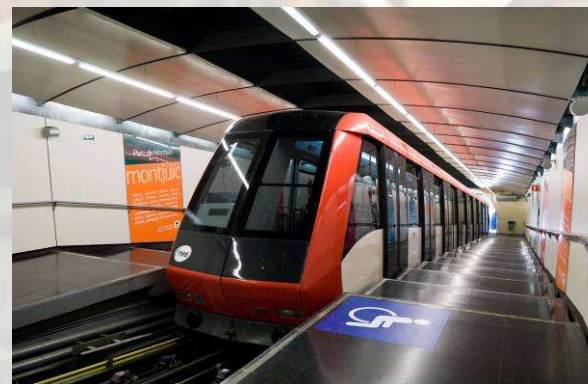
Funicular de Montjuïc