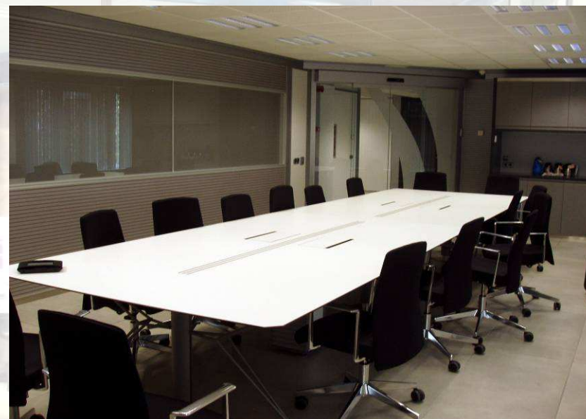
Sala de treball