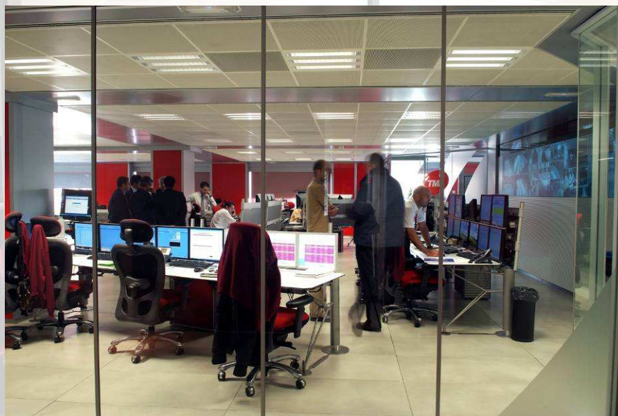
Sala del CCM