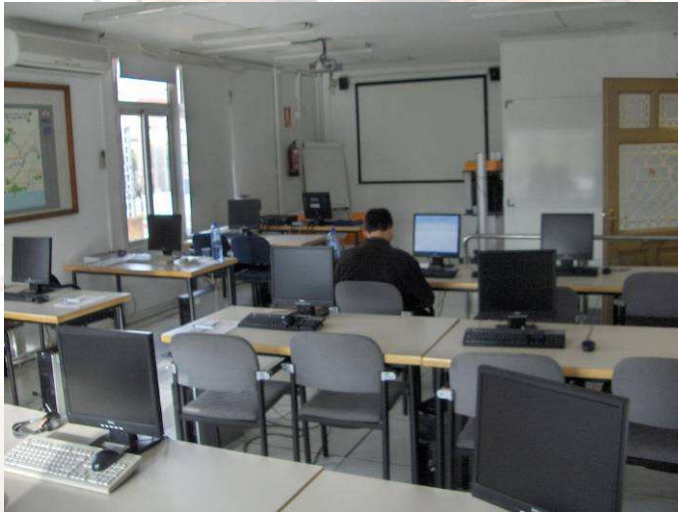
Aula 2 – Sta. Eulàlia