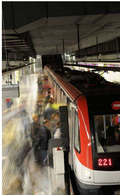
Tren sèrie 9000