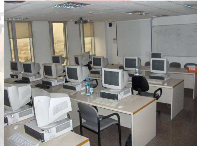
Aula 3 – Triangle