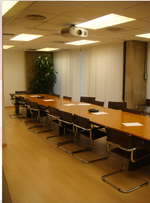
Sala de treball