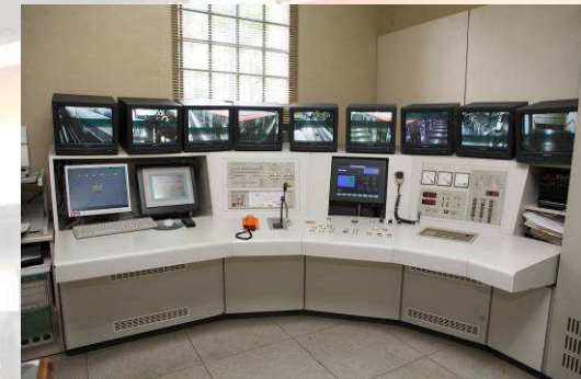
Sala conducció Funicular de Montjuïc